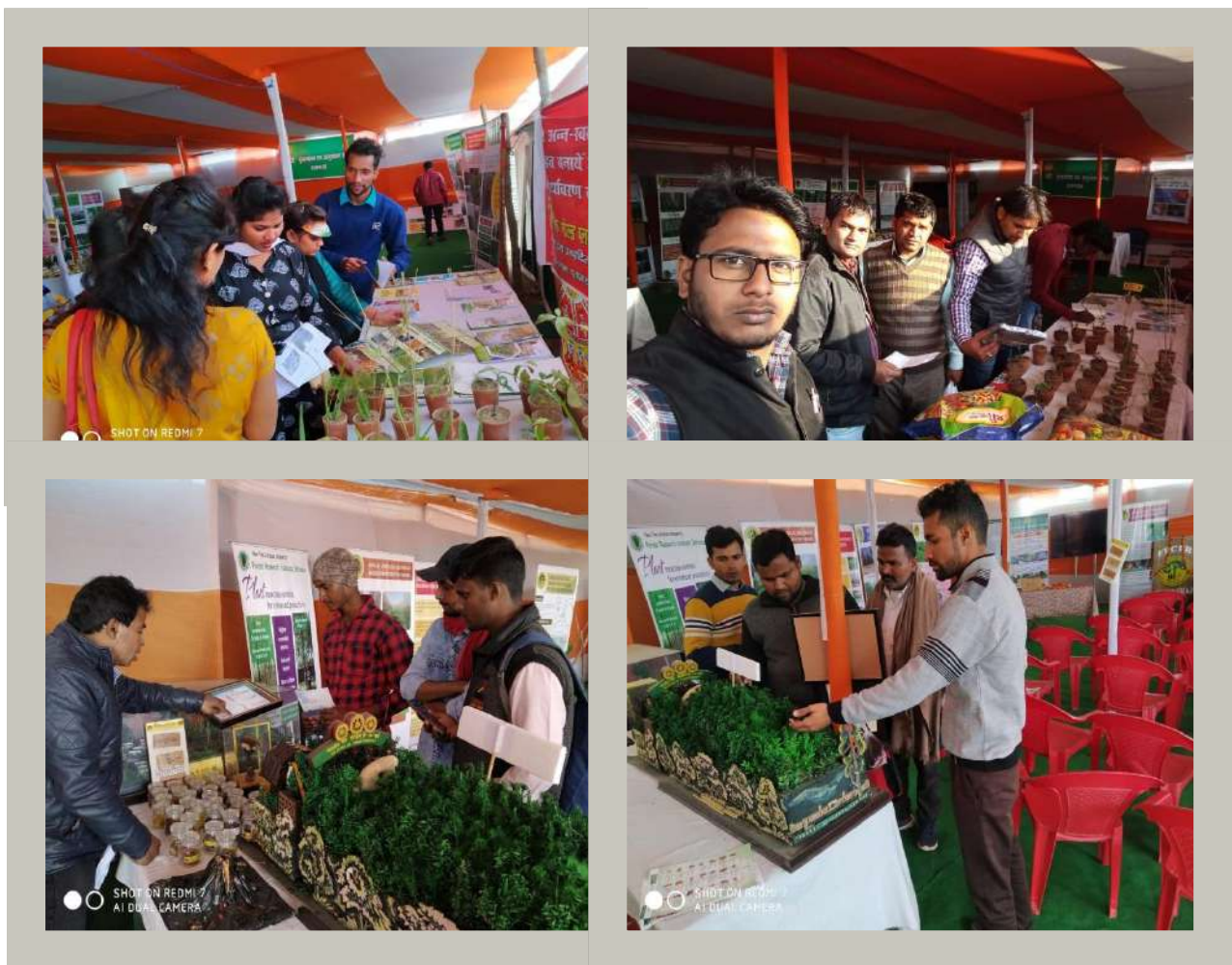
GLIMPSE OF THIS PROGRAM

About thousands of mela visitors visited the Camp and they were demonstrated different sections of the Camp.