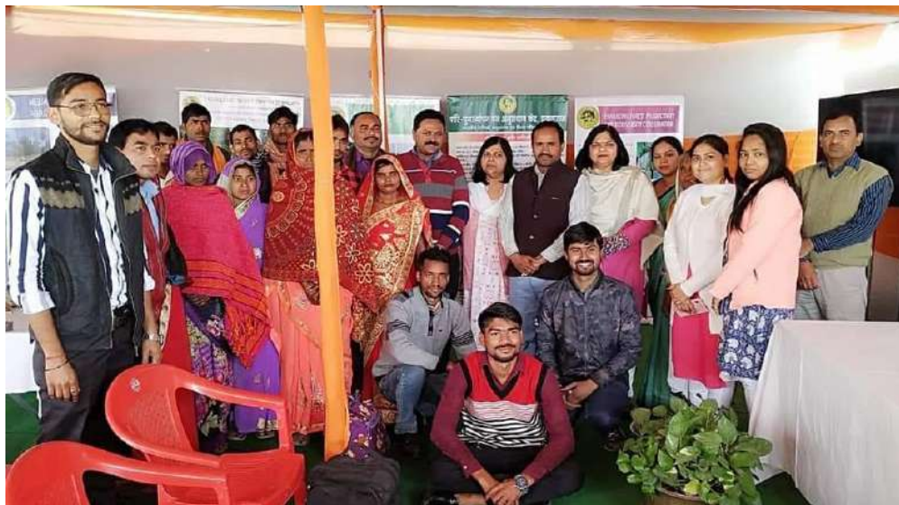
Group Photo of this training