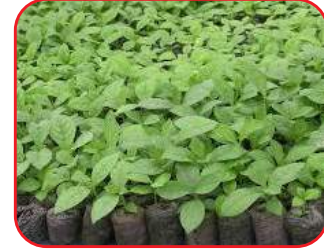
नर्सरी में सागौन का पौधा

पौध संरक्षण:- फफूँद प्रजाति- पौधे लेप्टोस्फरोलिना ट्रीयफोलाई , फोमा इक्विगुआ , फिलोस्टीकटा टेक्टोनी आदि फफूँदों से पौधों की पत्तियों में धब्बा रोग तथा मेक्रोफोमिना फैसिओलाइना से पत्तियों के सूखने वाला प्रकोप बढ़ता है। जिसे डाइथेन एम. 45 का 0.2 प्रतिशत घोल बनाकर छिड़काव करके नियन्त्रित किया जाता है। पत्तियों में चूर्णीय गेरूवादूली जो कि ओलिविया टेक्टोनी से फैलता है जिसे रोकने के लिए सल्फेक्स 0.2 प्रतिशत का छिड़काव किया जाता है।