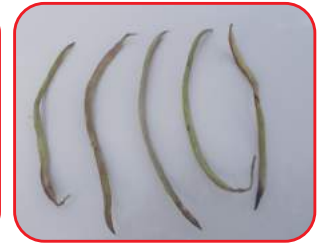
रोहिड़ा के बीज व फली

पूर्ण रूप से पकी हुई फलियों से सावधानीपूर्वक बीजों को निकाल कर कक्ष तापमान पर एकत्र किया गया। बीज अंकुरण के अध्ययन हेतु 15.25 से.मी. की पॉलीथीन बैग का उपयोग किया गया। बीजों को खाद : बजरी : मृदा के 1:1:2 अनुपात मिश्रण में 1.5 से 2.0 से.मी. की गहराई में उर्ध्वाधर बोया गया जिनका अंकुरण 3 से 6 दिनों की अवधि में प्राप्त हुआ।