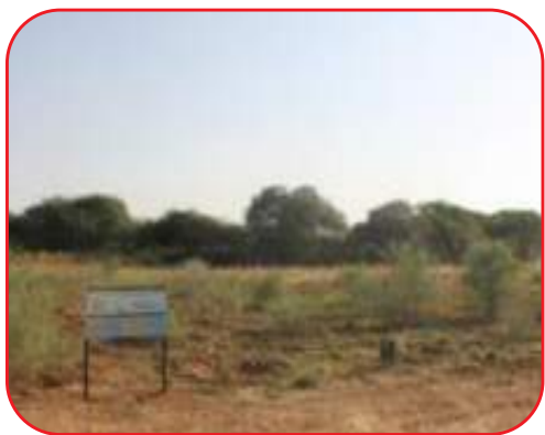
जोधपुर में स्थापित रोहिड़ा का प्रोजेनी परीक्षण प्रायोगिक क्षेत्र

चयनित सी.पी.टी के ईनहेरिटेन्स पैटर्न को जाँचने एवं सर्वोत्तम वृक्ष (elite tree) के चयन के लिए प्रोजेनी परीक्षण (progeny testing) हेतु पौधशाला में तैयार 36 प्रोजेनी का जोधपुर व झुंझुनु जिलों में एक एक प्रायोगिक क्षेत्र (field trial) स्थापित किया गया। परीक्षण हेतु प्रत्येक प्रोजेनी को चार रिप्लिकेशन में 3-3 मीटर दूरी के साथ आर. बी. डी (Random block design) डिजाइन में लगाया गया।