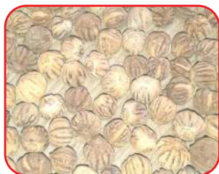
वेदरिंग किए हुए बीज

बीज एकत्रीकरण एवं भण्डारण- स्वस्थ पके एवं सूखे बीजों को फरवरी के अन्तिम सप्ताह से मार्च के अन्तिम सप्ताह तक सीधे पेड़ों से लम्बे डण्डे की सहायता से झड़ा कर एकत्र किया जाता है। सर्व प्रथम जिस पेड़ से बीज एकत्र किये जाने हैं उस पेड़ के नीचे अच्छी तरह सफाई करने के पश्चात् धुला हुआ कपड़ा