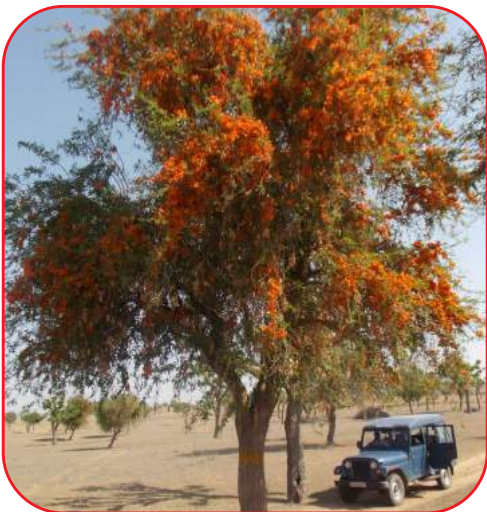
चयनित सी. पी. टी.

मार्च से मई माह के दौरान इन चयनित वृक्षों से ताजा फलियाँ एकत्र की गई तथा प्रत्येक वृक्ष के फलाद्रमिकी टिप्पणियाँ संबंधी आंकलन (Phenological observations) जैसे फूलों के रंग, फली व बीज के आकार का डेटा संगृहित किया गया। सभी फली और बीज अभिलक्षणों में काफी विभिन्नता देखी गई जैसे 100 बीजों का भार ( 0.6-1.3 ग्रा ), बीज लम्बाई ( 16.7-22.2 मि.मी. ), बीज चौड़ाई ( 8.3-9.3 मि.मी. ) और फली लम्बाई ( 18.6-26.2 से.मी. )।