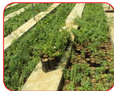
आफरी पौधशाला में चयनित वृक्षों के बीज से तैयार रोहिड़ा के पौधे