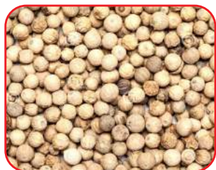
वेदरिंग नहीं किए हुए बीज

2. रासायनिक विधि- H_2SO_4 का 5 प्रतिशत का घोल बनाकर बीजों को 1 से 2 मिनट तक रखकर तुरन्त पानी में डालकर सूखाकर रगड़कर साफ करते हैं ऐसा तब करना पड़ता है जब तक खोल पूरी तरह से हट न जाये तदोपरान्त इन बीजों को बोने में उपयोग किया जाता है।