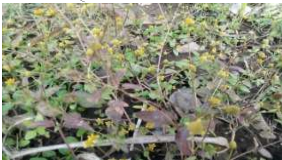
अकरकरा ( Spilenthus sp. )

जैसे दुधि ( Wrightia tinctoria ) सम्पूर्ण क्षेत्र में आच्छादित हैं।