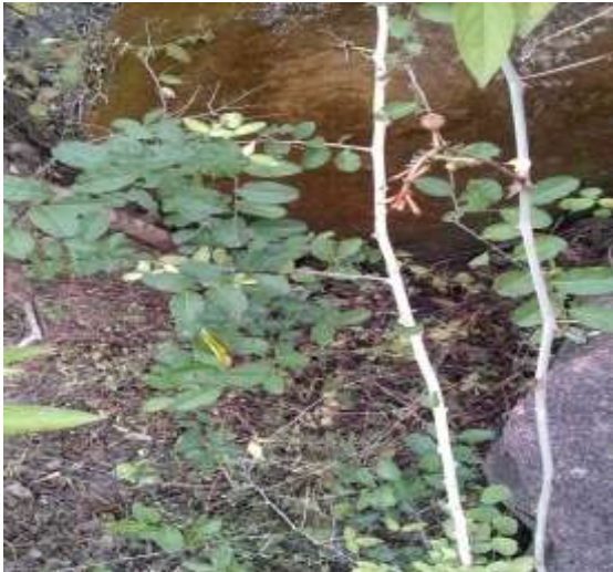
उलटकाँटा ( Capparis horrida )

इन पहाड़ियों पर तालाब और झरनों के आसपास तथा पहाड़ियों के तलहटी में जहाँ पानी का भराव होता है वहाँ भृंगराज ( Eclipta prostrata ), नागरमोथा ( Cyperus scariosus ), नागबेल तथा सफेद कुमुदनी, कम पाया जाने