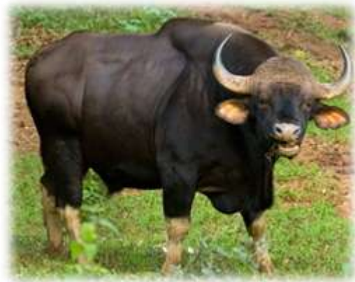
Bos gaurus (Gaur)

The rhizomes are edible and have been used for starch extraction. They have also been used a source of cellulose for paper manufacture and fibre for textiles. The flowers are also eaten, lightly steamed and served with a chilli sauce in Thailand. Rhizome and stem bases are diuretic, hypertensive, antidiabetic, antisiphilitic and antifungal. The rhizomes are also the source of essential oil that is used in perfumery and pharmaceutical preparations. The rhizome of Hedychium coronarium is used in Chinese medicine and has been prescribed and used in the treatment of headache, lancinating pain, diabetes, inflammatory and intense pain due to rheumatism, etc. It also has uses as a tonic, excitant and anti-rheumatic in the Ayurvedic system. It is also used by Manipuri women to make a floral ornament.