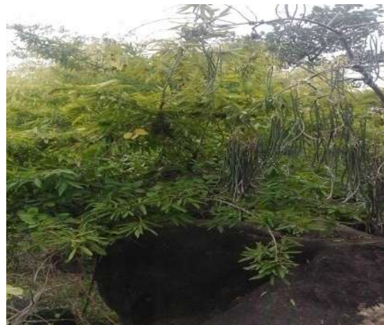
अकोल ( Alangium lamarckii )

इसके अतिरिक्त न केवल वृक्ष बल्कि कुछ महत्वपूर्ण लताएं जिनमें कुछ तो औषधीय गुणों से युक्त तथा ज्यादातर समय हरी-भरी बनी रहती हैं, जैसे- गिलोय या अमृतबेल ( Tinospora cordifolia ), अमरबेल ( Cuscuta ), और गुडमार तथा कुछ अन्य जैसे द्वीमरबेल ( Ichnocarpus frutescens ), उलटकाँटा