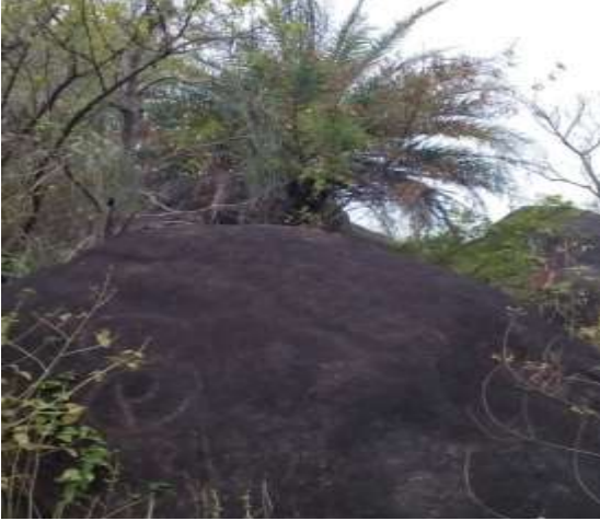
खजूर ( Phoenix dactylifera )

जबलपुर शहर जितना अपने इतिहास से समृद्ध है, उतना ही वह अपने प्राकृतिक खजाने से भी समृद्ध है। इसके पहाड़ी क्षेत्र इसे और भी समृद्ध बनाते हैं, जिनका विस्तार मुख्यतः गढ़ा क्षेत्र से लेकर मदन महल पहाड़ियों एवं बरगी पहाड़ियों तक फैला हुआ है, जो कि अपने आप में प्रकृति के अनुपम रंगों को समेटे हुए हैं। इन पहाड़ी क्षेत्र में आबादी का प्रभाव बहुत कम है इसलिए यहाँ अनेको किस्म के पौधे व जीव-जन्तु आज भी प्राकृतिक रूप से पाए जाते हैं। इन पहाड़ियों पर प्राकृतिक तथा रानी दुर्गावती द्वारा बनवाये हुए कई तालाब भी हैं, जो इस परिआवास को और भी समृद्ध बना देते हैं।