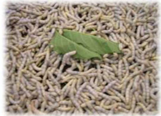
शहतूती इल्लियों का पालन

करते समय तकनीकी मापदण्डों को ध्यान में रखना चाहिए, क्योंकि कोया उत्पादन लागत में लगभग 50 प्रतिशत धनराशि शहतूत पत्तियों के उत्पादन में ही व्यय होता है । अतः यह आवश्यक है कि प्रति इकाई क्षेत्र में अधिकतम शहतूत पत्तियों का उत्पादन हो जिससे रेशम उद्योग से अधिकाधिक लाभ प्राप्त किया जा सके । ऐसी भूमि जो उसरीली न हो तथा जहां पानी का ठहराव न हो, एवं सिंचाई व्यवस्था हो, वहां शहतूत का पौधा लगाया जा सकता है, परन्तु बालुई-दोमट भूमि शहतूत वृक्षारोपण के लिए सर्वथा उपयुक्त होती है । शहतूत वृक्षारोपण सामान्यतः जुलाई/ अगस्त एवं दिसम्बर/ जनवरी (सिंचाई सुविधा आवश्यक) में किया जाता है । मानसून की वर्षा से पूर्व भूमि की तैयारी प्रारम्भ की जाती है । जमीन की 30-35 से.मी. गहरी जुताई के साथ ही गोबर की सड़ी खाद भूमि में मिलाई जाती है । शहतूत की पौध तैयार करने की अनेक विधियां हैं जैसे शहतूत बीज द्वारा, शहतूत कटिंग द्वारा, लेयरिंग द्वारा, ग्राफ्टिंग द्वारा । उपरोक्त विधियों में से कटिंग द्वारा सरलता तथा न्यूनतम व्यय के आधार पर शहतूत पौध तैयार किये जा सकते हैं । इस विधि से पौध तैयार करने से