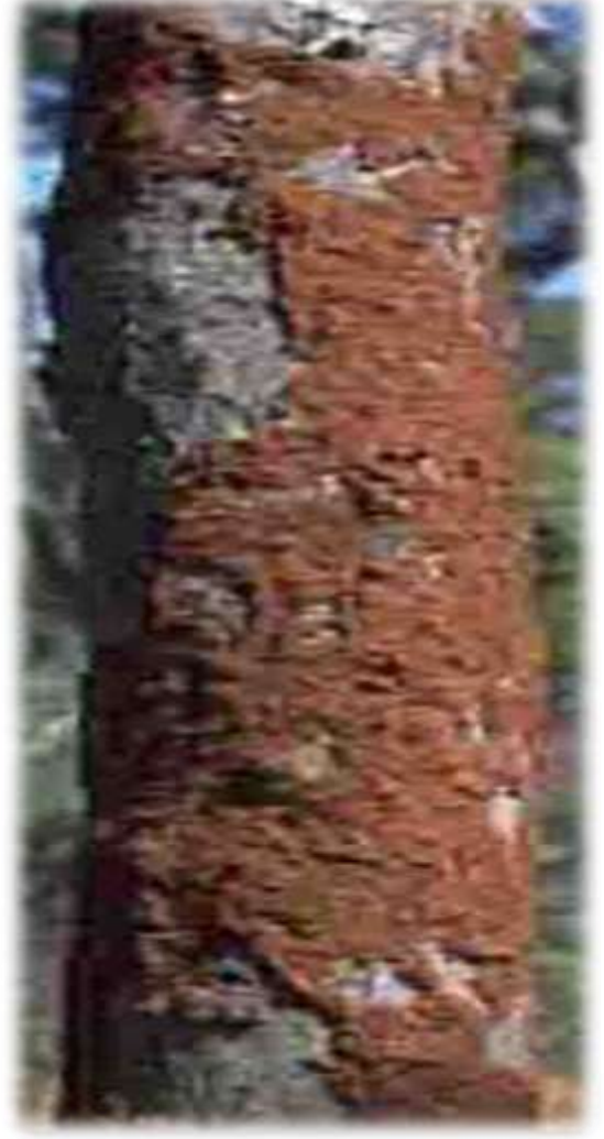
वाळवी द्वारा ग्रासित झाडे

पिकांचे अवशेष, मातीतील सेंद्रीय खत खातात परंतू असे अन्न उपलब्ध नसेल तर त्या थेट शेतीतील पिकांचे नुकसान करतात. वाळवीचा प्रादुर्भाव झाडांच्या कोणत्याही अवस्थेला असू