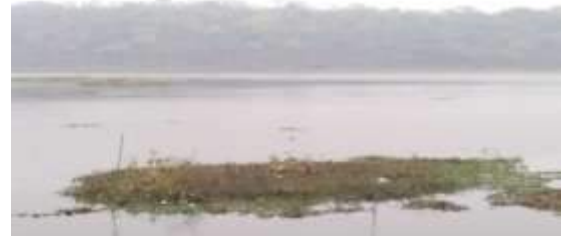
संग्राम सागर में जलकुंभी ( Eichhornia crassipes )

इस प्राकृतिक परिवारावास में ऊँचे पहाड़ होने के