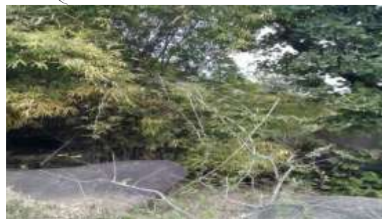
देशी बाँस ( Dendrocalamus strictus )

( Capparis horrida ), केवाँच ( Mucuna pruriens ), मकोर ( Ziziphus oenoplia ) आदि भी बहुतायत में यहाँ पायी जाती हैं। कुछ अन्य कंद वाली वनस्पतियाँ जो केवल वर्षा में ही ऊगती हैं, जैसे- बैचाँदी ( Dioscorea dremona , Roxb), काली मूसली ( Curculigi orchiodes ), जिमीकंद ( Amorphophallus paeoniifolius ) आदि भी यहाँ पायी जाती हैं तथा इनमें से ज्यादातर वनस्पतियों के कंद साल भर ऊपरी भाग मर जाने के बाद भी जीवित बने रहते हैं जोकि जंगली सुअर एवं खरगोश आदि को सूखे व कम वनस्पतियों वाले दिनों में भोजन उपलब्ध कराते हैं।