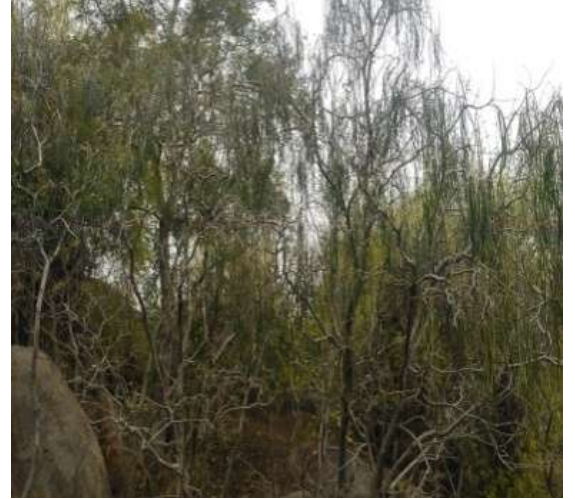
दुधि ( Wrightia tinctoria )

( Mangifera indica ), इमली ( Tamarindus indica ) तथा खजूर ( Phoenix dactylifera ) भी मौजूद हैं। गुलर ( Ficus glomerata ) और पाकर ( Ficus lacor ) भी चट्टानों के बीच अपनी जड़े जमाए यत्र-तत्र दिखायी पड़ते हैं। जंगल की इस प्राकृतिक वनस्पति पर बंदर, लंगूर, पहाड़ी चूहे, गिलहरी और अनेक किस्म के पक्षी निर्भर रहते हैं। कुछ महत्वपूर्ण वनौषधियाँ सीमित पहाड़ियों पर ही उगती हैं, जैसे- मरोड़फली