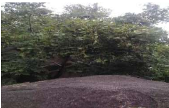
कसई ( Bridelio retusa )

स्थानीय लोग बहुत से घरेलु उपचार में काम आने वाली इन औषधियों के लिये इन पहाड़ियों पर ही निर्भर रहते हैं, जैसे- बेकल ( Gymnosporia montana ) खाँसी दूर करने में, मरोड़फली ( Helicteres isora ) पेट की मरोड़ व दर्द में, गुडमार ( Gymnema sylvestre ) – मधुमेह में, भुईआँवला ( Phyllanthus amarus ) – पीलिया दूर करने में, महाबला ( Sida acuta ), बला ( Sida cordifolia ) और अतिबला ( Sida indica ) का प्रयोग सर्पदंश, गठियां और ज्वरनाशक के रूप में