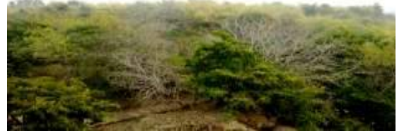
गढ़ा क्षेत्र की प्राकृतिक वनस्पतियाँ

यहाँ मुख्यतः छोटे तथा मझोले किस्म के वृक्ष पाए जाते हैं तथा औषधीय पौधों की बहुत सी किस्में भी पायी जाती हैं। यहाँ जंगली फलों के पौधें जैसे- अकोल ( Alangium lamarckii ) एवम तेन्दु ( Diospyros melanoxylon ) बहुतायत में पाये जाते हैं। साथ ही साथ देसी फलदार वृक्ष जैसे सीताफल ( Annona squamosa ), आम