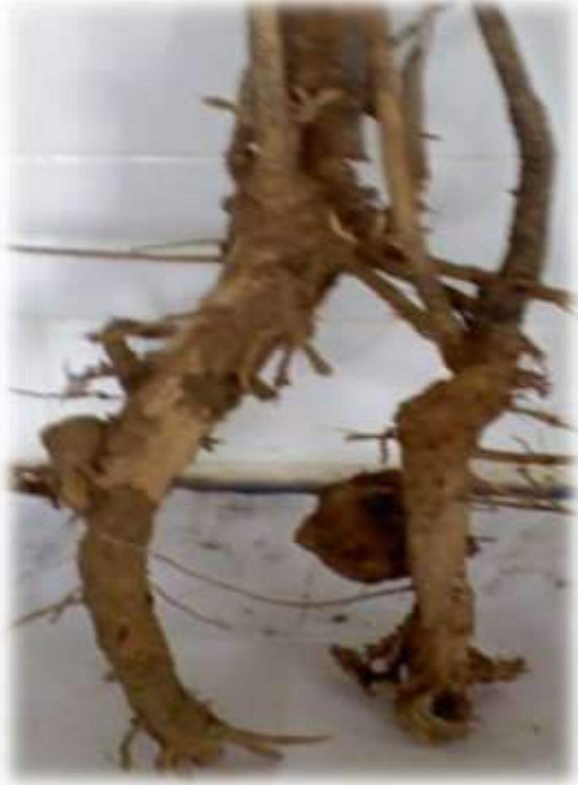
वाळवी द्वारा ग्रासित झाडे

वाळवी सर्व किटका मध्ये जास्त नुकसान करणारे कीट असून हे आयसोप्टेरा वर्गाचे आहे. भारतात वाळवीच्या ३०० प्रजाती असून त्यातील ४० प्रजाती आर्थिकदृष्ट्या झाडांना नुकसान करणाऱ्या आहेत. वाळवी बियाणे, झाडांची मुळे, साल आणि काष्ठागारा मधे संग्रहित केलेल्या लाकडांना खूप नुकसान पोहचवतात. बुरशी वाढवणाऱ्या वाळवी तर शेतीसाठी अधिकच नुकसान- दायक असतात. अश्या प्रकारच्या वाळवी मृत सेंद्रीय पदार्थ,