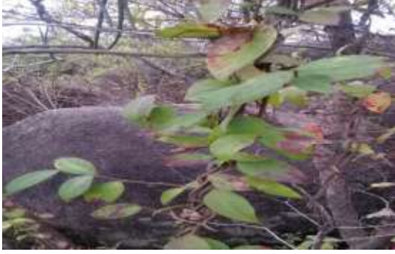
गुडमार ( Gymnema sylvestre )

इन पहाड़ियों पर तालाब और झरनों के आसपास तथा पहाड़ियों के तलहटी में जहाँ पानी का भराव होता है वहाँ भृंगराज ( Eclipta prostrata ), नागरमोथा ( Cyperus scariosus ), नागबेल तथा सफेद कुमुदनी, कम पाया जाने