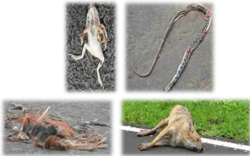
Killing of Wild Animals on the Road by traffic movement

Although, road kill of wild fauna by heavy vehicular traffic needs to be discussed at appropriate forum the possible way out could be by displacing the wild life presence at the places of their abundance in the forest area along with other measures controlled like vehicle speed. The construction of flyover and alternate roads outside the forest area could also be another option.